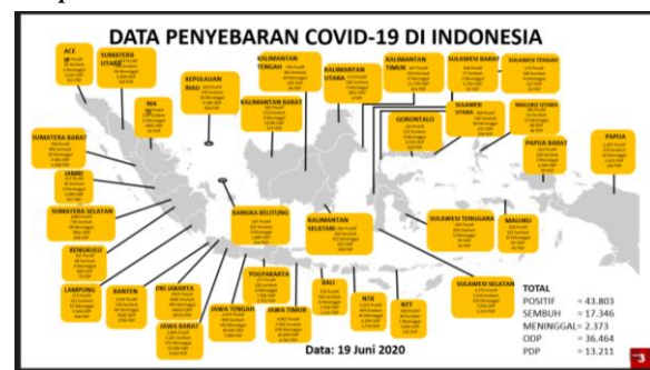
Gambar 1 : Data Penyebaran Covid-19 di Indonesia Periode 19 Juni 2020

Setelah itu secara beruntun pemerintahan mengeluarkan berbagai kebijakan terkait pencegahan dan penanganan Covid-19. Pemerintah melalui Gugus Tugas Percepatan Penanganan Corona Virus Disease 2019 (COVID-19) , setiap sore pada tayangan televisi secara nasional, menghimbau agar warga Indonesia tidak lupa menjaga kesehatan dan menjaga kebersihan di lingkungan rumah mereka terutama untuk diri mereka sendiri. Ini juga termasuk pencegahan di lingkungan Istana Negara, dengan melakukan pengukuran suhu tubuh untuk tamu yang akan datang di istana. Dari hari kehari penambahan kasus virus corona terus bertambah baik ODP dan PDP hingga suspect .